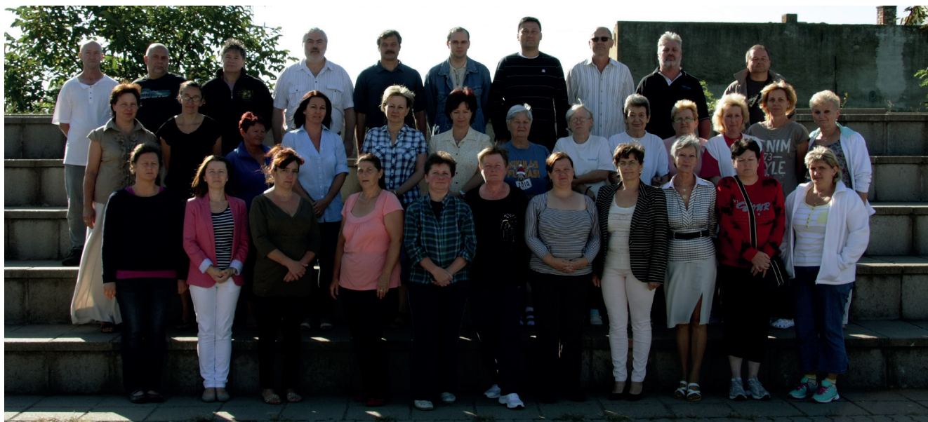
Technikai dolgozók csoportképe