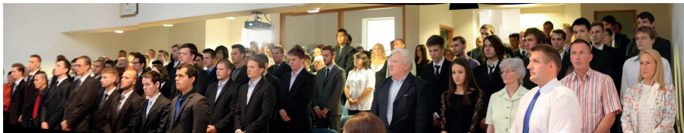
Technikus avató ünnepség