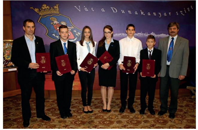
Vác Város kitüntetett diákjai

Iskolánkban egy komoly és összetett elismerési rendszer alakult ki az évek során. Ezen belül külön kategóriát képeznek az éppen ballagók által átvettek, hiszen az ő esetükben nem egy tanév, hanem a nálunk eltöltött idő egészét vesszük figyelembe. Külön emeli az átadás fényét, hogy ez több ezer ember előtt a ballagási ünnepségen történik. Legmagasabb szintű elismerésünk a „Boronkay Emlékérem”, amelyre pályázni kell és egy előre meghatározott pontrendszer szerint rangsoroljuk a diákokat. Itt pl. 100 pontot ér egy OKTV győzelem, s 10 pontot egy kiváló tanulói cím. El lehet ezek után képzelni, milyen teljesítmények voltak a díjazott diákjainknál, ahol már csak a jelöléshez is minimum 260 pontot kellett elérni.