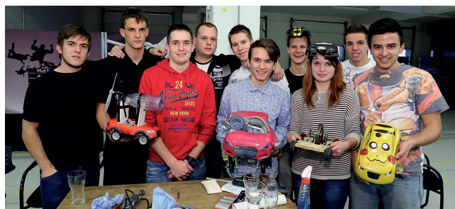
AUDI Kreativty csapatunk

A közismereti tantárgyak eredményességét illetően kiemelkedik a matematika, amely egyrészt a sokféle versenynek, másrészt a műszaki jellegű képzésünkhöz igazodóan a tantárgy fontosságának tulajdonítható. Ebből a tantárgyból országos összesített rangsor alapján is (beleértve az elit gimnáziumokat is) az igen előkelő 2. helyen állunk. Szerencsére azonban a többi tantárgy is sorra országos szintű eredményeket tud felmutatni tanáraink kiváló tehetséggondozó munkájának köszönhetően.