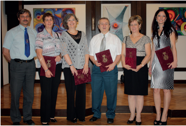
Vác Város kitüntetett tanárai